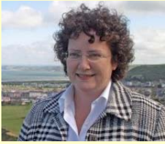
Elin Jones kondigt een 'pilot cull' aan in Wales

Op 30 maart j.l. heeft het 'National Assembly for Wales' een voorstel ingediend om dassen te doden in de strijd tegen runder TB. Minister van plattelandszaken Elin Jones heeft dat voorstel aangenomen en een 'pilot cull' aangekondigd in Wales.