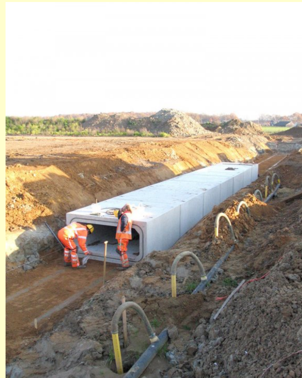
Aanleg ‘innovatieve’ faunatunnel bij viaduct Asenray in het traject van de A73